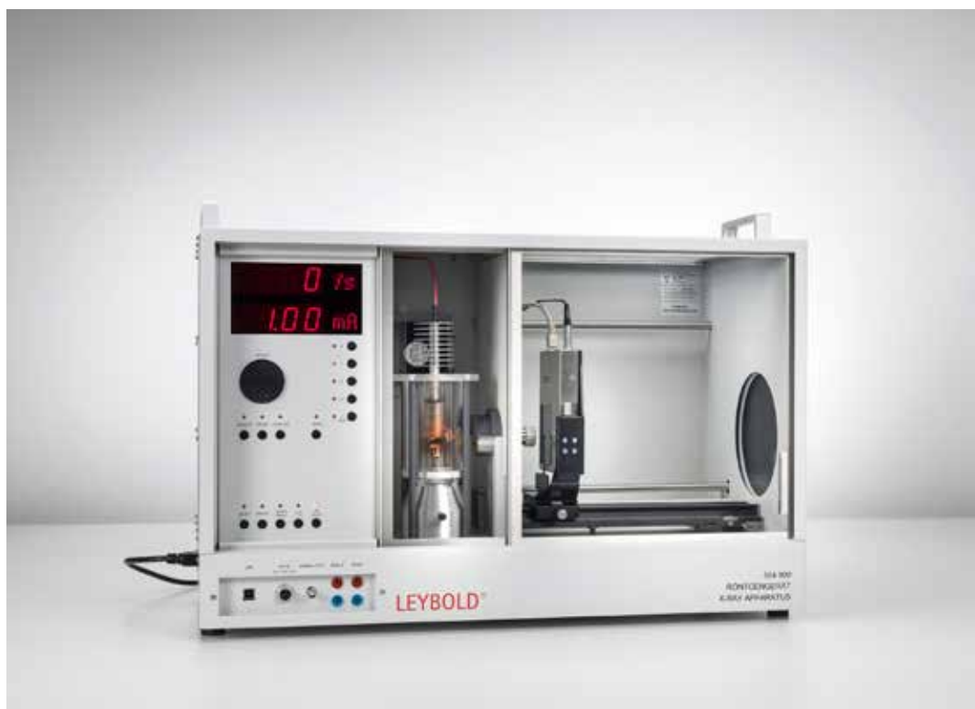
Diagrama digital de Laue: Investigación de la red cristalina de monocristales (P7.1.2.5)

Diagrama digital de Debye-Scherrer: Determinación de la distancia reticular interplanar de muestras de polvo policristalino