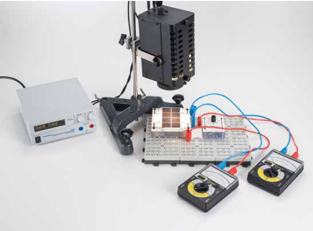
Registro de las curvas características de corriente y tensión de una batería solar en función de la intensidad de irradiación (P4.1.1.3)

P4.1.1.3 Registro de las curvas características de corriente y tensión de una batería solar en función de la intensidad de irradiación